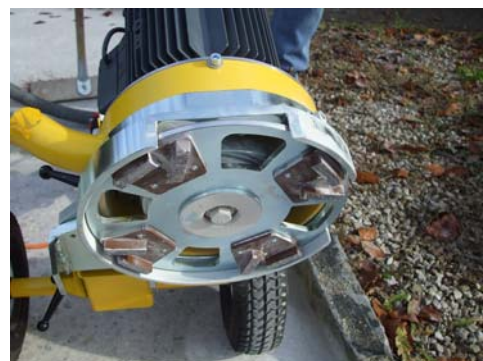
LEICHTES AUSWECHSELN DER SCHLEIF- UND FRÄSSEGMENTE